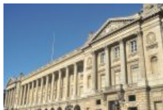
Sarkozy annonce une commission sur l'utilisation de l'hôtel